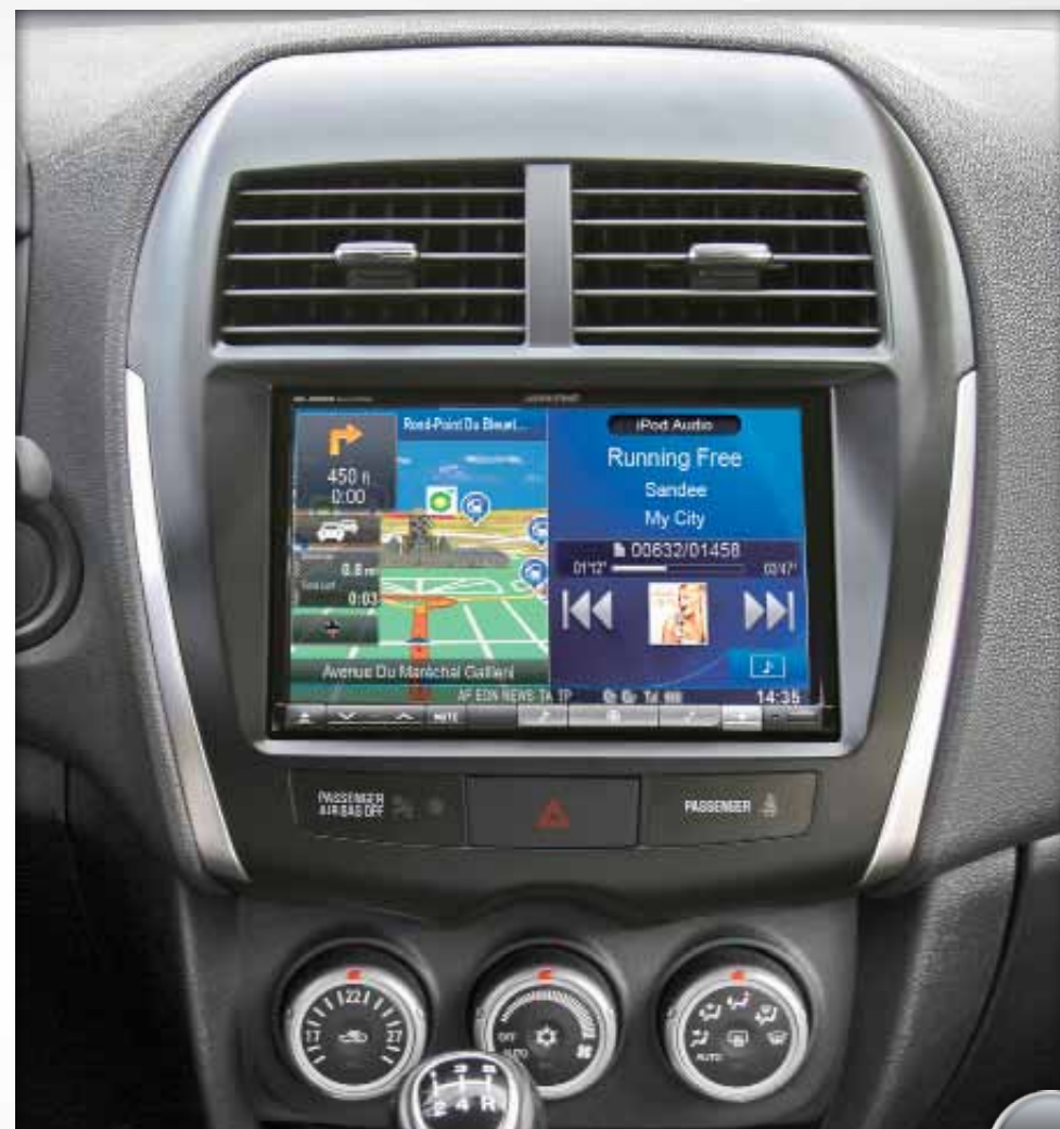
Mitsubishi - ASX