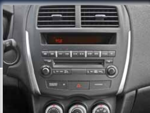
Oryginalny ekran Mitsubishi OEM

Ulepsz swój fabryczny System Nawigacji za pomocą ekstra dużego 8-calowego wyświetlacza i ciesz się nową technologią od Alpine oferującą znakomite działanie, prowadzenie do celu oraz bezpieczeństwo!