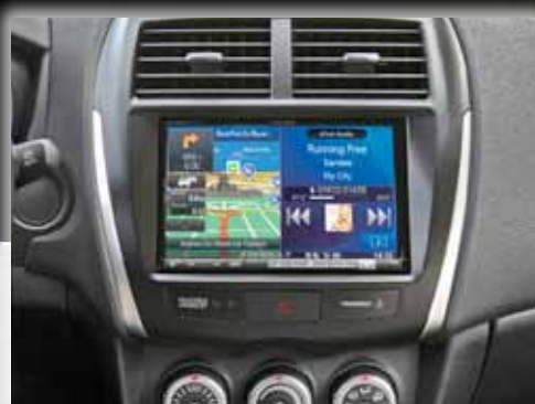
8" ekran Alpine INE-W928R