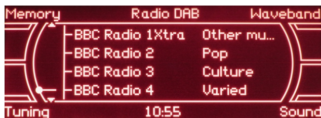
Przykładowa lista dostępnych stacji radiowych rys.5

Po zakończeniu skanowania system automatycznie wyświetli dostępną listę stacji radiowych rys.5. Wybór stacji następnej lub poprzedniej odbywa się przy użyciu głównego pokrętki nawigacyjnego lub dolnych przycisków rys.6.