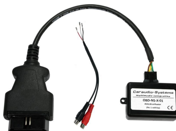
OBD-N5-X-01 Klucz sprzętowy do kodowania